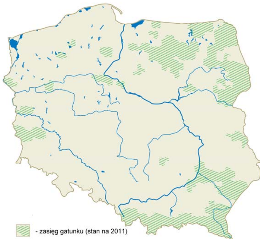
Rys. 2. Aktualny zasięg występowania wilków w Polsce (źródło: Gula 2008b, Jędrzejewski i in. 2008, Nowak i Mysłajek 2011, Nowak i in. 2011, dane PGL LP).

ników i watah, duże arealty, nakładanie się arealów i duża mobilności wilków) identyfikacja taka nie wydaje się możliwa. Nie jest też jasne, czy ocena opiera się o projekcję średnich wielkości arealów watah oraz liczebności watah, czy o rzeczywiste rozpoznawanie wilków i watah na podstawie zgromadzonych rekordów.